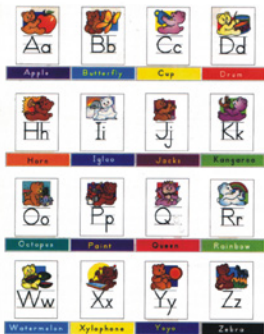
TCM1853- Bear Alphabet