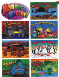
TCM1786- Manners (7 個圖表)