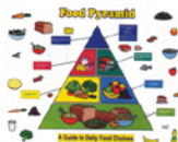
TCM1778- Food Pyramid