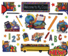
TCM1792- School Tools