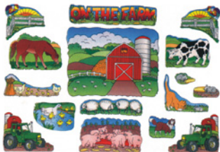
TCM1791- On the Farm