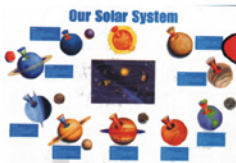
TCM1772- Solar System